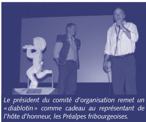
Le président du comité d'organisation remet un « diablotin » comme cadeau au représentant de l'hôte d'honneur, les Préalpes fribourgeoises.